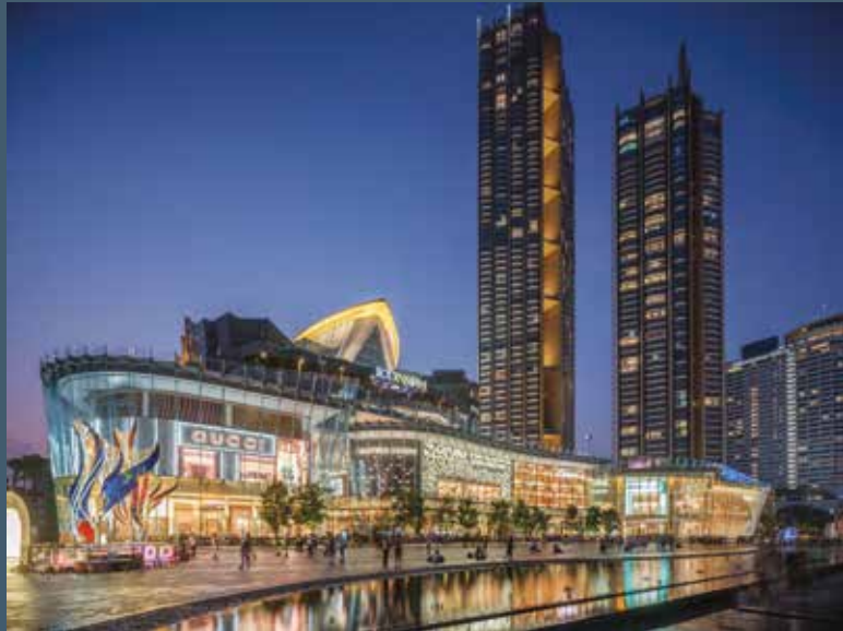
Icon Siam Shopping Mall