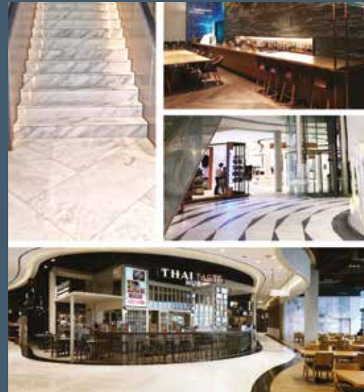
King Power Duty Free Shopping Mall