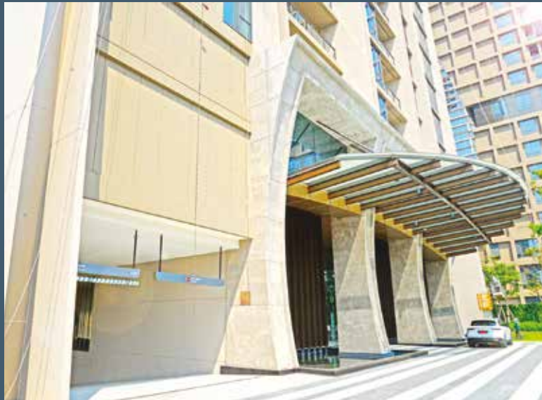
Sindhorn Kempinski Hotel